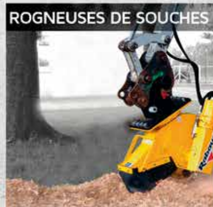
ROGNEUSES DE SOUCHES