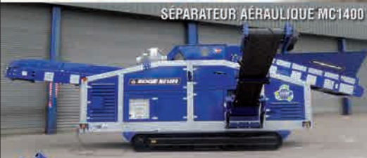
SÉPARATEUR AÉRAULIQUE MC1400