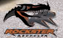
CONCASSEUR À PERCUSSION AVEC CRIBLE EMBARQUÉ, 40T, R1100DS