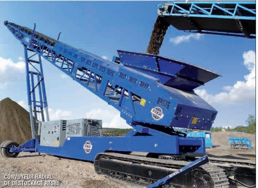
CONVOYEUR RADIAL DE DESTOCKAGE RTS80