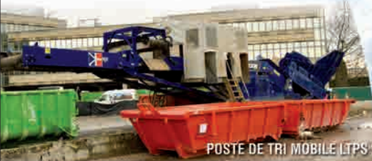
POSTE DE TRI MOBILE LTPS