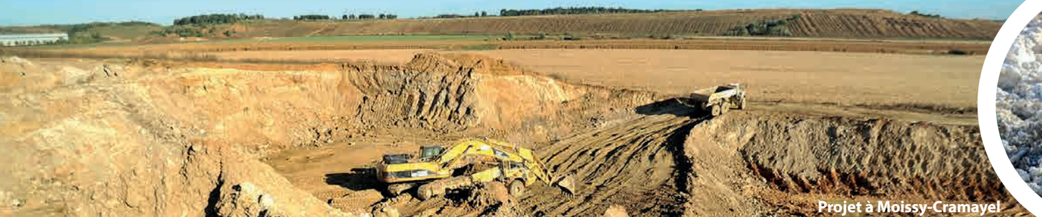
Projet à Moissy-Cramayel