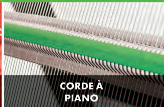
CORDE À PIANO

LARGE STOCK DE GRILLES CARRÉES, ALLONGÉES ET ANTI-COLMATANTES