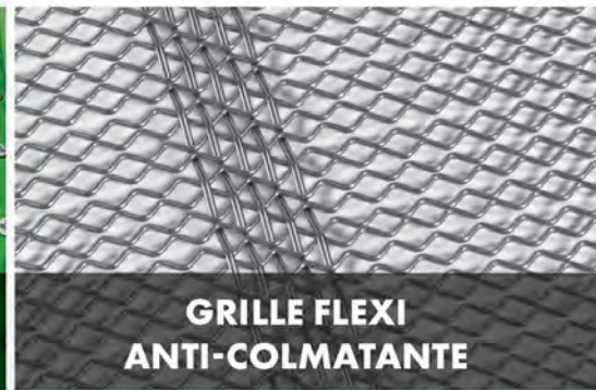
GRILLE FLEXI ANTI-COLMATANTE

HARPSCREEN EST LE PRINCIPAL FABRICANT DE GRILLES ET MATÉRIEL DE CRIBLAGE AU ROYAUME-UNI ET AU NORD DE L'IRLANDE