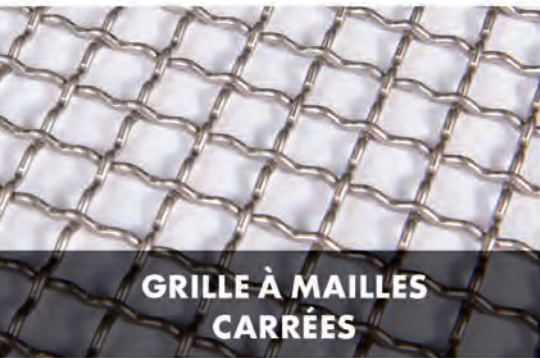
GRILLE À MAILLES CARRÉES