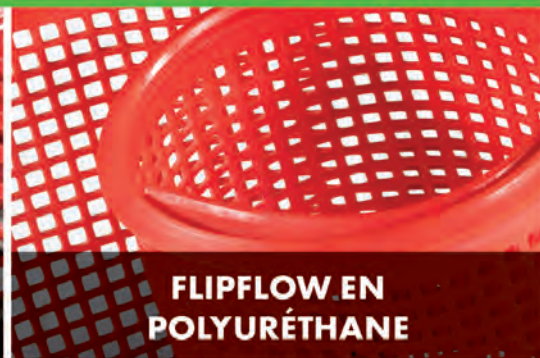
FLIPFLOW EN POLYURÉTHANE