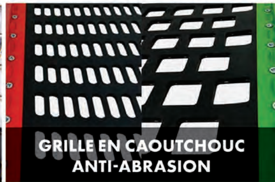
GRILLE EN CAOUTCHOUC ANTI-ABRASION