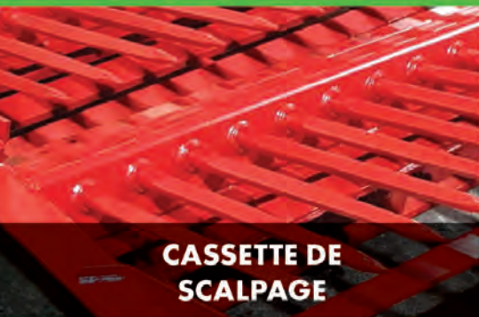
CASSETTE DE SCALPAGE

HARPSCREEN EST LE PRINCIPAL FABRICANT DE GRILLES ET MATÉRIEL DE CRIBLAGE AU ROYAUME-UNI ET AU NORD DE L'IRLANDE